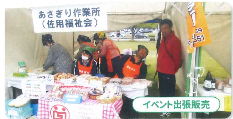
イベント出張販売