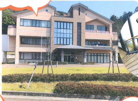
特別養護 老人ホーム