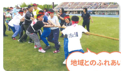
地域とのふれあい