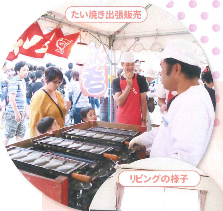
たい焼き出張販売

佐用町商店街内に拠点を構えています。 『地域の中で暮らす自分』を見つけることができます。 佐用町栄町自治会にお世話になり、隣保活動に参加しています。